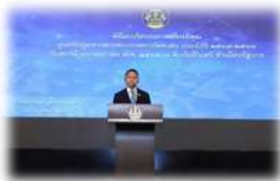
นายสมศักดิ์ เทพสุทิน รองนายกรัฐมนตรี