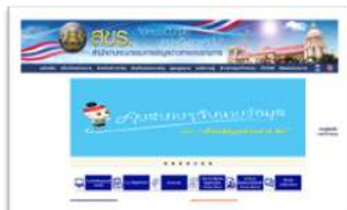
เว็บไซต์ใหม่

๔.๙.๒ การให้บริการระบบศูนย์ข้อมูลข่าวสารอิเล็กทรอนิกส์ของราชการ (Infocenter) มีหน่วยงานของรัฐขอใช้บริการทั่วไป จำนวน ๑๓๒ หน่วยงาน จัดทำตามโครงการจัดตั้งศูนย์ข้อมูลข่าวสารของราชการจำนวน ๑,๒๐๐ หน่วยงาน ดังนั้น หน่วยงานที่ใช้ Template ของสำนักงานคณะกรรมการข้อมูลข่าวสารของราชการ ทั้งหมด ๙,๖๗๓ หน่วยงาน พร้อมทั้งดำเนินการปรับปรุงข้อมูลหน่วยงานในศูนย์ข้อมูลข่าวสารแห่งชาติ จำนวน ๑,๘๘๑ หน่วยงาน และมีผู้เข้าใช้บริการศูนย์ข้อมูลข่าวสารอิเล็กทรอนิกส์ของราชการ สำนักงานปลัดสำนักนายกรัฐมนตรี จำนวน ๓๐,๘๖๕ ราย