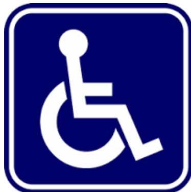
สัญลักษณ์ผู้พิการ