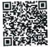
มติคณะกรรมการ กฟผ. ครั้งที่ 1/2564