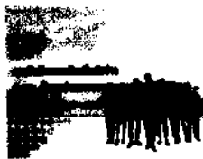
ข่าวประชาสัมพันธ์

สรุปผลการรับฟังความคิดเห็นต่อร่าง พ.ร.บ. ข้อมูลข่าวสารของราชการ (ฉบับที่....) พ.ศ. .... จำนวนรายละเอียด | ดู