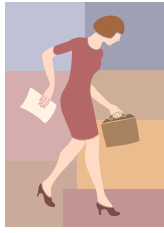
ประชาชน ผู้ที่ต้องการข้อมูลข่าวสารของ การไฟฟ้านครหลวง