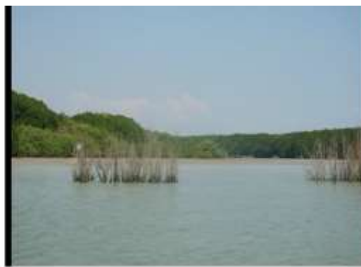
การนำกิ่งไม้มาปักบริเวณร่องน้ำ

การวางโพงพาง เป็นวิธีการจับสัตว์ทะเลอีกรูปแบบหนึ่ง ในช่วงเวลานี้โพงพางเป็นเครื่องมือดักกุ้งในน้ำลึก การดักโพงพางของชุมชนปากน้ำปากพูน นิยมดักในตอนน้ำขึ้น เพราะถือว่ากุ้งมากับกระแสน้ำ วิธีดักโพงพางใช้ไม้หลาโอน ไม้โกงกางหรือไม้ค้ำที่มีลำต้นตรงขนาดเท่าขาคนความยาวเมื่อฝังดินแล้วให้โผล่เหนือ น้ำ อย่างน้อย ๑.๕ - ๒ เมตร ปักเป็นเสา ๒ เสา ให้ห่างพอ ๆ กับปากโพงพางประมาณ ๕ - ๖ เมตร เรียกว่า กลักซั้ง หรือหลักโพงพางเพื่อผูกเชือกปลายเสาให้เป็นที่สังเกตของเรือที่ผ่านไปผ่านมาและมีการห้อยตะเกียงไว้ที่เสาไม้ เพื่อป้องกันเรือประมงพาณิชย์วิ่งชนโพงพางที่ดักไว้ให้มีแนวเฉียงออกไปเท่ากันทั้งสองข้างเป็นปีก