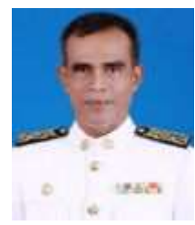
นายแมน พิกุลจร รองนายกเทศมนตรีเมืองปากพูน