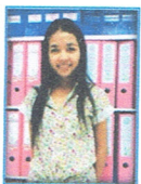
นางสาวนุจรี ทรงพระนาม