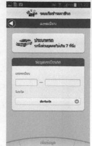
กรอกข้อมูลรายละเอียดรถ หนึ่งท่านสามารถลงทะเบียน ได้ 5 คัน