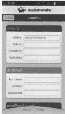
ลงทะเบียนผู้ใช้งาน และ สถานที่ที่จัดส่งเอกสาร