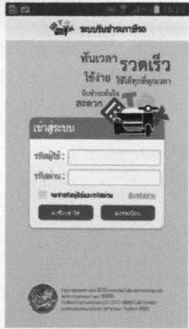
Download application "ชำระภาษีรถ" ผ่าน Play สตอร์