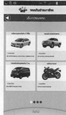
เลือกประเภทรถที่ต้องการชำระ รถเก๋ง รถตู้ รถกระบะ รถมอเตอร์ไซด์