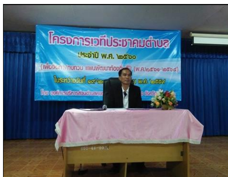
โครงการเวทีประชาคมตำบล