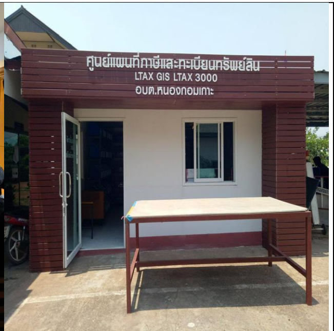
โครงการปรับปรุงข้อมูลแผนที่ภาษี