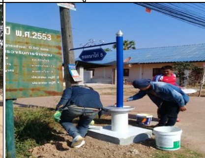
โครงการติดตั้งป้ายชื่อบ้าน ป้ายซอย