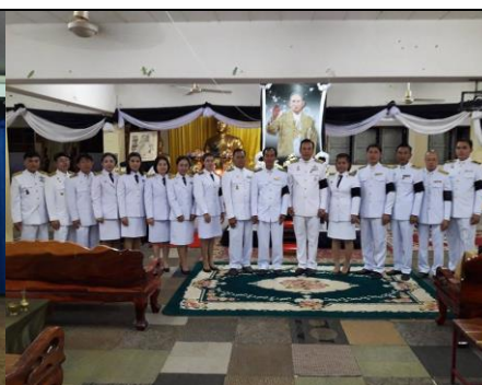
โครงการเทิดทูนพระมหากษัตริย์ พ่อหลวง