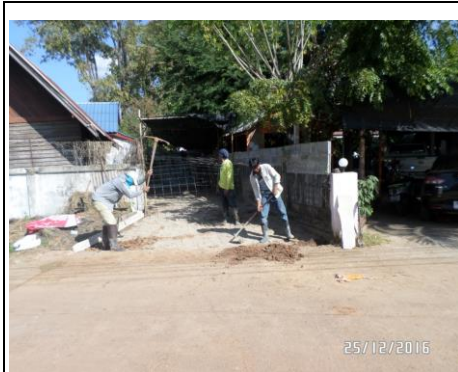
ก่อสร้างถนน คสล. (นาไก่ ๒/๑)