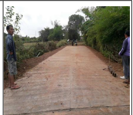
ก่อสร้างถนน คสล. ม.๑๐