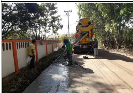
ขยายไหล่ทาง คสล.+วางระบายน้ำ คสล. ม.๗