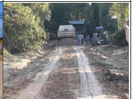
ก่อสร้างถนนลูกรัง ม.๙ (ซอยวัดนาเหลาทอง)