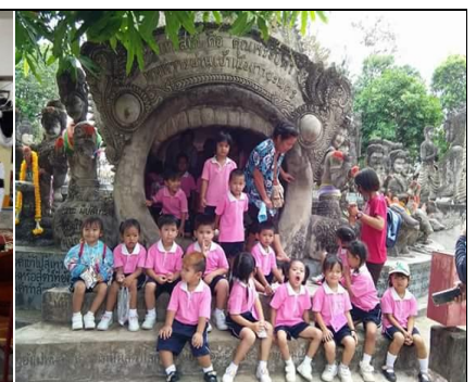
โครงการทัศนศึกษาดูงานศูนย์ พัฒนาเด็กเล็ก