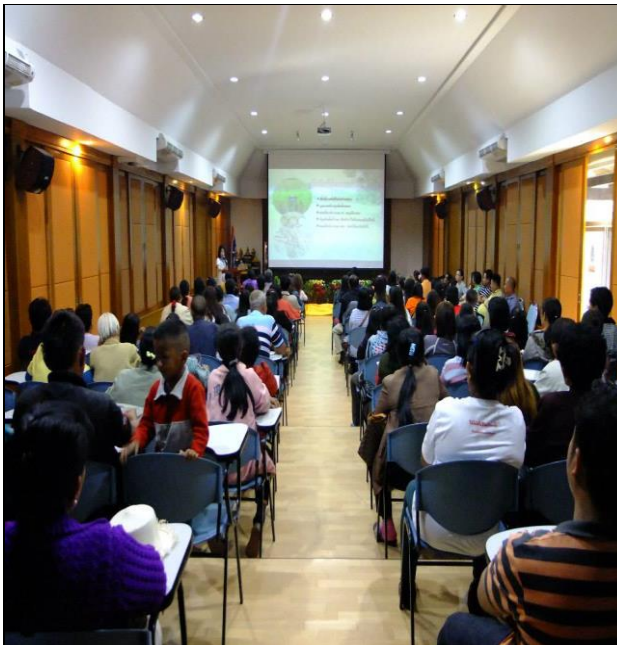
โครงการศึกษาดูงานนอกสถานที่