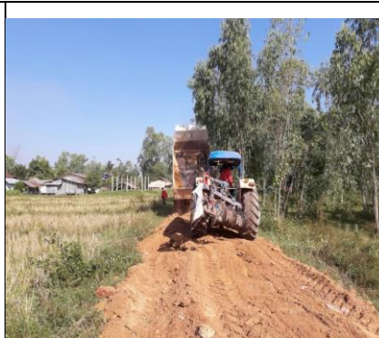
ก่อสร้างถนนลูกรัง ม. ๙