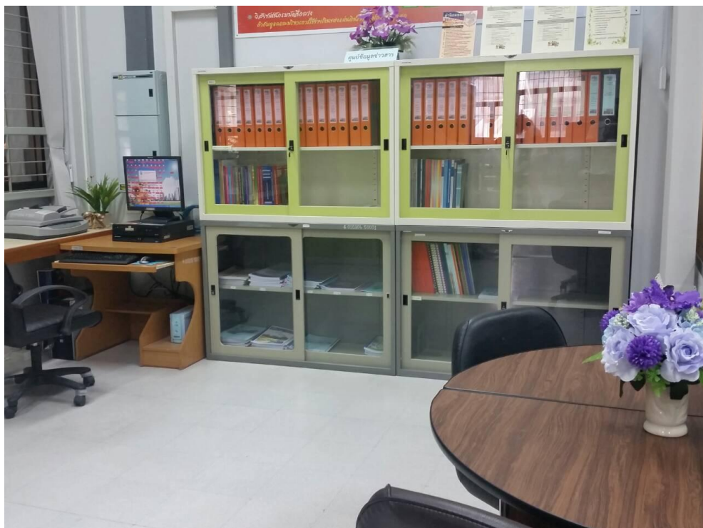
ภาพภายในศูนย์ข้อมูลข่าว ณ มิถุนายน 2558

8.3 ข้อมูล/เอกสารเกี่ยวกับสิ่งแวดล้อม และสุขภาพ (7 มิ.ย. 2553) ข้อมูลข่าวสารที่จัดให้ประชาชน เข้าตรวจดูได้ ตามวรรคหนึ่ง ถ้ามีส่วนที่ต้องห้ามมิให้เปิดเผยตามมาตรา 14 หรือมาตรา 15 อยู่ด้วย ให้ลบหรือ ตัดทอนหรือทำโดยประการอื่นใดที่ไม่เป็นการเปิดเผยข้อมูลข่าวสารส่วนนั้น บุคคลไม่ว่าจะมีส่วนได้เสียเกี่ยวข้องหรือไม่ก็ตาม ย่อมมีสิทธิเข้าตรวจดู สำเนา หรือ ขอสำเนาที่มีค่าธรรมเนียมของข้อมูลข่าวสารตามวรรคหนึ่งได้ ในกรณีที่เหมาะสมหน่วยงานของรัฐโดยความเห็นชอบของคณะกรรมการจะวางหลักเกณฑ์เรียกค่าธรรมเนียม ในการนั้นก็ได้ ในการนี้ให้คำนึงถึงการช่วยเหลือผู้มีรายได้น้อยประกอบด้วย ทั้งนี้เว้นแต่จะมีกฎหมายเฉพาะบัญญัติไว้เป็นอย่างอื่น คนต่างด้าวจะมีสิทธิตามมาตรานี้เพียงใดให้เป็นไปตามที่กำหนดโดยกฎกระทรวง