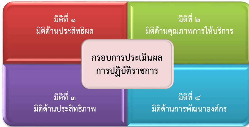
แผนภาพที่ ๑ กรอบการประเมินผลการปฏิบัติราชการของส่วนราชการ

ส่วนราชการจะดำเนินการจัดทำคำรับรองและประเมินผลการปฏิบัติราชการ เพื่อปฏิบัติราชการตามคำรับรอง ภายใต้กรอบการประเมินผลทั้ง ๔ มิติ ตามแผนภาพที่ ๑ ดังนี้